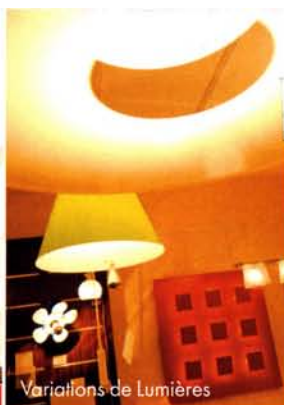
Variations de Lumières