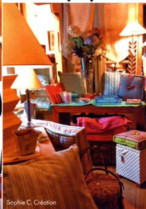
Sophie C. Création